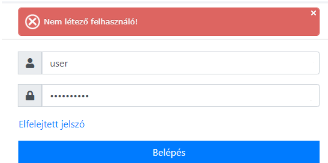
1.4 ábra – Bejelentkezés hibaüzenet

A bejelentkezés bármilyen okból történő elrontása esetén hibaüzenet jelenik meg