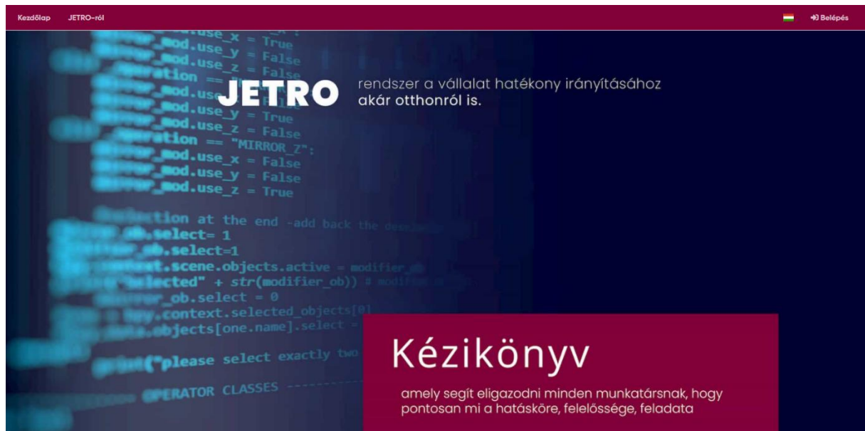
1.1 ábra – Főoldal

Az 'ENTER' billentyű lenyomása után a JETRO főoldalát látjuk az oldal betöltését követően.